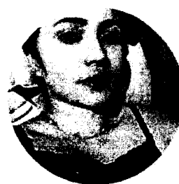
น้องแนน ธุรการ