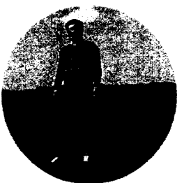
"I AM DEW"