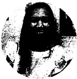
พี่ขวัญ กายภาพ